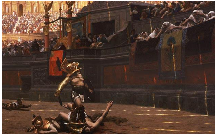
Слика 4: Гладијаторске борбе.

У старом Риму организоване су гладијаторске игре које су одисале бруталношћу и суровишћу. Гладијатори су углавном били робови, који би били бачени у одређени кавез са дивљим животињама, па је ова “игра” заправо представљала борбу за голи живот. Велики број смрти гладијатора, није умањивао забаву Римљана, а еуфорија око одржавања гладијаторских борби није јењавала. “... нарочито морбидну пасију према гладијаторским борбама је показивао владар Комодус (Lucius Aurelius Commodus Antoninus) који је и сам учествовао у њима, тако што би окупио инвалиде који су у рату или због болести остали без ногу и хладнокрвно их убијао у борилишту.” 25