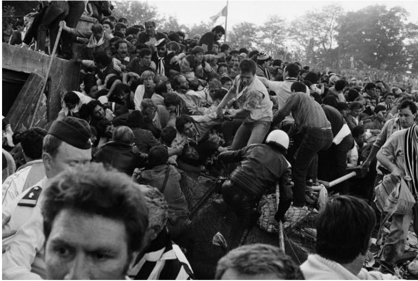
Слика 5: Трагедија на Хејзелу.

догодиле на фудбалским стадионима. Као санкција за погибију великог броја људи уследила је реакција у виду забране играња енглеских тимова на европским такмичењима.