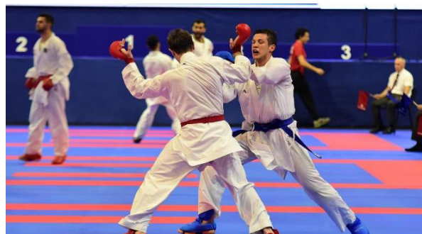
Слика 2: Агресивност у борилачким спортовима.

Код појединих спортова, одређени степен агресивности и насилничког понашања представља циљ и потпуно је очекиван. Наиме, борилачки спортови су такве природе да се извођење техника према противнику своди на наношење повреде или бола противнику, при чему су учесници у борбу ушли потпуно свесни те опасности. Бокс, цудо, карате, рвање, само су неки од дугачког списка борилачких спортова. Проблематика која се јавља код ових спортова огледа се у сасвим легалном наношењу повреда другом лицу, те се поставља питање да ли овакво понашање представља насиље. Карате, као најмасовнији борилачки спорт, настао је у Јапану, а значење речи карате у буквалном преводу значи празна рука. Дакле, уместо оружја у каратеу се користи тело како би се савладао противник, без употребе било каквих помагала. Постојање низа удараца и примене различитих техника према противнику чиме се наноси бол и повреда, са разлогом отвара дискусију о насиљу у овим спортовима.