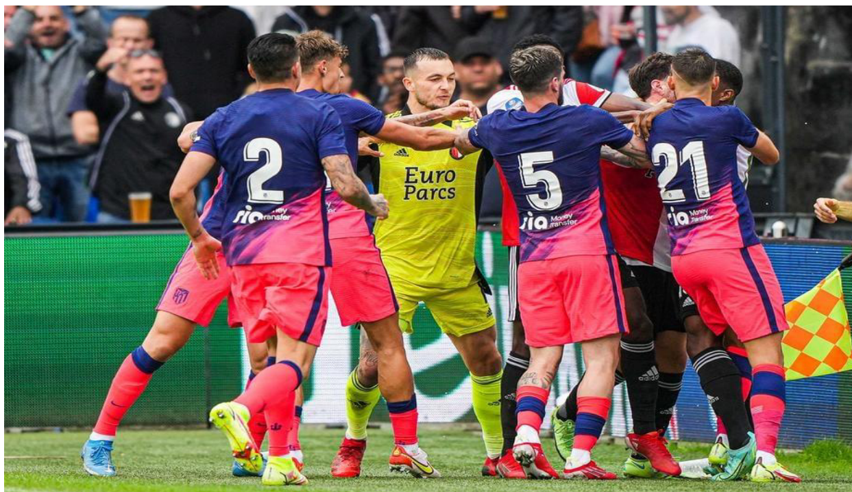
Слика 1: Физички обрачун играча на терену.

Резултати ових истраживања показали су да се насиље међу спортистима углавном испољава кроз вербално насиље, у виду вређања, исмевања, претњи и застрашивања, док се физичко и сексуално насиље ретко дешава. Као мере превенције предлажу се доношење Етичких кодекса који ће примењивати сви учесници у спорту, медијске акције усмерене ка афирмисању права детета и омладинског спорта, адекватна казнена политика за све видове неспортског, непримереног понашања и сл. Као посебан вид насиља међу спортиста јавља се тзв. виртуелно насиље. Оно се одвија употребом интернета и мобилних телефона, а углавном је присутно код млађих генерација спортиста. Друштвене мреже се користе за различите облике увреда, дељења непримереног садржаја о некоме, чиме жртва оваквог насиља бива етикетирана.