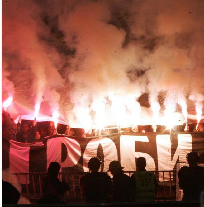
Слика 12: Навијачка кореографија.

Интересовање аутора за ову материју може се везати и за посету неколико мечева рукометног клуба „Партизан“ у престижном такмичењу Лиге Шампиона. Наиме, мечеви рукометног такмичења одржани су у Нишу, а сходно забрани који је клуб тада имао. Иако је посета овим мечевима била искључиво од стране присталица „Партизана“ навијачи две различите фракције налазили су се одвојено, те сваки понаособ водили навијање, да би касније ушли у сукоб и физички обрачун, чиме инциденти нису могли бити спречени.