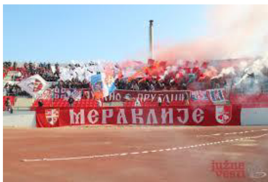
Слика 14: Навијачи „Радничког”.

Група “Мераклија” увек је истицала локал патриотизам и трудила се да временом одржи концепт на коме је настала. Ривалитет са клубовима који долазе из других градова годинама се развијао, те се данас најоштрији сукоб одржао према клубовима из Београда – са „Партизаном” и „Црвеном звездом”. „Највећу одбојност Мераклије имају према навијачима из главног града, што су и показали на утакмици са Црвеном Звездом када су на истоку окачили малу заставу са натписом "Мењам Београд за Книн". 148 Разлог нетрпељивости нишког клуба према клубовима из Београда, може се наћи у дугогодишњем осећању инфериорности који се везује за људе са подручја југа Србије. Комплекс који генерације вуку за собом преносе на своје потомке и усађују им антипатију према главном граду. Како су навијачи у свему екстремистички оријентисани, то не чуди да се оваква нетрпељивост посебно истиче приликом сусрета са београдским клубовима.