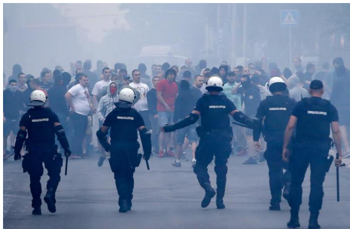
Слика 7: Полиција против навијача.

Сукоб ових двеју група, са једне стране државне апаратуре, а са друге полуорганизованих хулиганских група, предствља социјални феномен, који је условљен читавим низом фактора везаних за однос државе и њених грађана. Дакле, сукоби великих размера могу се посматрати из више углова. Најпре, органи унутрашњих послова као државни органи има овлашћења која су им гарантована законом, те примена силе према изазивачима масовних нереда на утакмицама апсолутно је у складу са њиховим опсегом задатака. Наоружање које поседују може се применити према навијачима, а њихова одговорност може бити утврђена тек у случају прекорачења овлашћења, што се у оваквим прилика не дешава често. Навијачке групе се пак користе илегалним наоружањем или користе различита средства која им могу послужити да повреду другог, попут каменица, бакљи, других оштрих предмета и сл. Управо због тога свака држава се бори да успостави што боље мере превентиве како би се навијачке групе могле укротити, те смањиле евентуалне кобне последице. Посебно се мора водити рачуна да „полиција не сме навијаче да посматра као хомогену целину, већ мора да разликује оне који нису, од оних који јесу спремни на насиље.“ 51