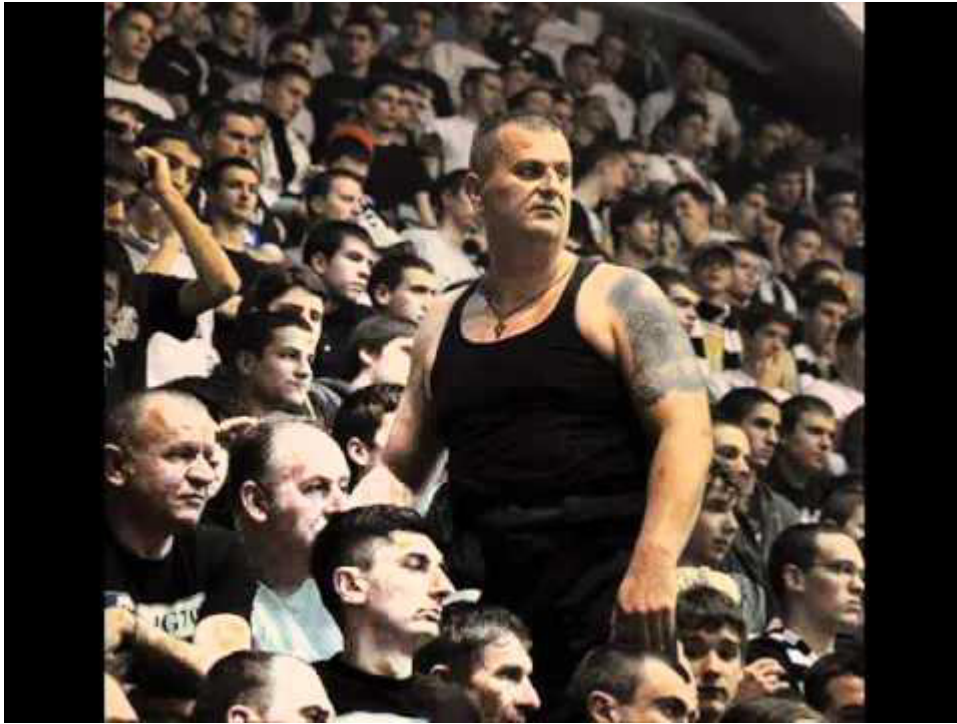
Слика 6: Вођа навијача на трибини.

Одабир вође хулиганске групе заснован је примитивним принципима наметања и аутократског начина „владања“ групом. Вођа се истиче својим изузетно окрутним и насилним понашањем, вршењем тешких кривичних дела, застрашивањем, на који начин стиче и ужива поштовање међу својим члановима. „Репутација у навијачком дискурсу означава јак медијски утицај, хулигански карактер у обрачунима међу такмацима, као и саму организацијску посвећеност и бројност на масовним спортским окупљањима, попут стадиона, хала и других навијачких ритуала.“ 43 Вође обично предводе навијање и песму навијача, имају своје посебно месту на трибини, а окупљена маса се придружује песми и заједно са вођом подржава свој клуб. „Ауторитарни карактер потребан хијерархијским шемама у навијачким колективима често се заснива на патријархалном гламуру, ексцентричности и мачоистичким телесним идентитетима који предводе навијачки покрет.“ 44 Саджина навијачких песама углавном се базира на понижавајућим и деградирајућим слоганима, који противнички тим или судије унижавају. Етничка мржња и нетрпељивост и те како је присутна у репертоару навијачких песама, само се мењају