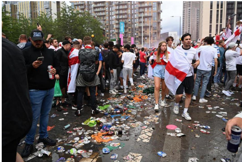
Слика 11: Енглески навијачи.

које врше лица под дејством алкохола и других недозвољених средства. „Алкохол заправо прави погодну психолошку подлогу за унос дроге, повећава спремност на ризике и хедонистичке тенденције у личности. Зато је вероватно тај контингентни коефицијент корелације између коришћења једне и друге врсте супстанце тако висок.“ 109 Имајући у виду карактеристике дејства ових средстава на организам, не чуде бурне емоционалне реакције навијача, које су праћене неконтролисаним изливима беса. „Аришита указује на то да насиље на стадионима често има подлогу у ситуационим факторима као што су дејство алкохола и утицај психологије масе који произлази из чланства у навијачкој групи.“ 110