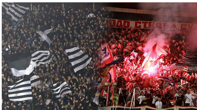
Слика 13: Сукоб „Делија“ и „Гробара“.

На трибинама стадиона одвија се навијачки дерби, наспрам оног који се одвија на спортском терену. Навијачи имају задатак да надгласају супарника, а уколико то није могуће могу се користити и разним недозвољеним средствима попут бакљи и пиротехнике. Локализација навијачких група протеже се углавном иза голова тимова, а приступ супарничким навијачима није дозвољен. Полиција и жандармерија обезбеђују сусрете ових ривала, будући да се ради о спортским приредбама високог ризика.