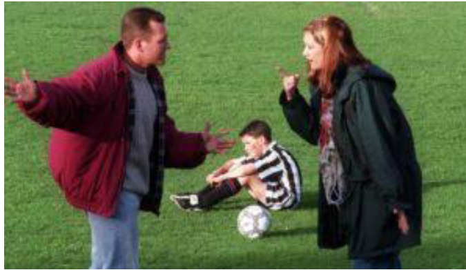
Слика 3: Насиље родитеља.

Наиме, родитељи врло често нису објективни када су у питању њихова деца. Дете које је „најбоље“ у свакој активности, вероватно је у бити просечних или исподпросечних способности. Како родитељи не прихватају реалност, гурају децу у спорт, терајући их да се баве нечим што они сами не желе, то деца осећају велики притисак који бива окидач за појаву анксиозности. У старијем узрасту, уз тренажни процес укључују се и такмичења и турнири где се деца међусобно надмећу. Довољно је једном отићи на утакмицу децјег узраста где се може осмотрити велики број насилних излива родитеља. Куде децу, прекоравају их, псују, вређају, а некада и физички кажњавају због лоше игре. Има и оних родитеља који насиље усмеравају ка тренеру у случају да им дете седи на клупи и не учествује на утакмици. Тренери у оваквим ситуацијама могу бити изложени разним претњама, уценама од стране родитеља, који по сваку цену желе да њихово дете буде у игри.