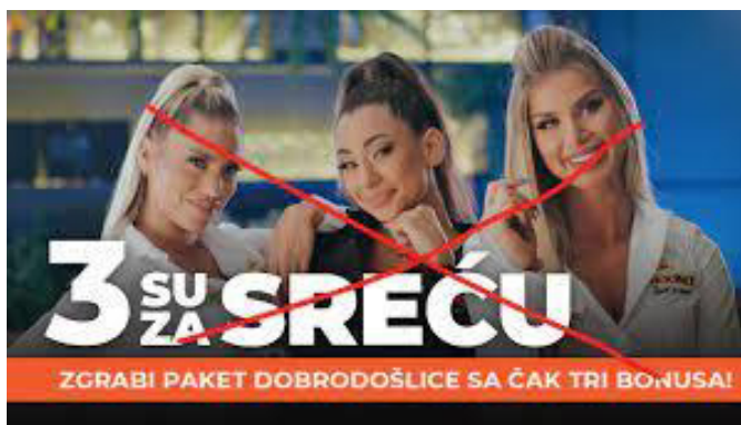
Слика 11: Предаторно рекламирање.

Присуство женског пола у овој области може имати и други вид свог испољавања. Рекламирање спортских кладионица и коцкарница углавном чине познате личности, независно од пола. Међутим, све је чешће присуство дама које обнажене стоје као заштитно лице неке спортске кладионице.