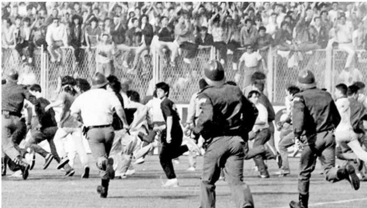
Слика 9: Утакмица Динамо – Црвена звезда на Максимиру 13. маја 1990. године .

До кулминације јаза међу југословенским народима долази на утакмици између Динама из Загреба и Црвене Звезде. Како је већ било за очекивати да ће националистички набоји и превирања доживети светло дана, то се и десило на фудбалској утакмици, која је остала упамћена по општој тучи навијача оба тима, а све уз директан пренос утакмице, што је донело нову призму овог сукоба.