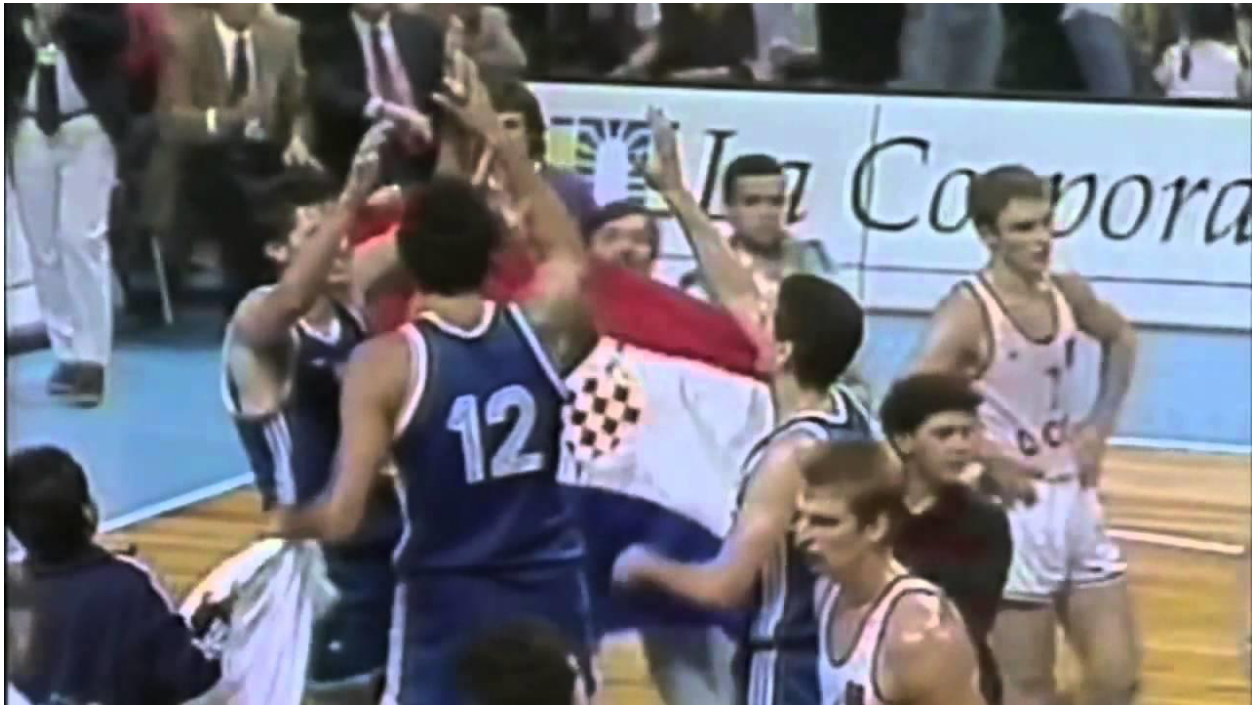
Слика 10: Национална обележја.

Сећање на кошаркашку утакмицу са Совјетским Савезом у Аргентини и настанак сукоба између Владе Дивца и покојног Дражена Петровића није имао срећни епилог. Иако наступ под југословенском заставом, још тада се спремао велики распад некадашње државе, чиме је донекле ова утакмица показала праву слику друштва. Замена југословенске заставе хрватском и велика фама којом су два великана окончала контакт, представљали су само увод у сукобе који су уследили 90-их година.