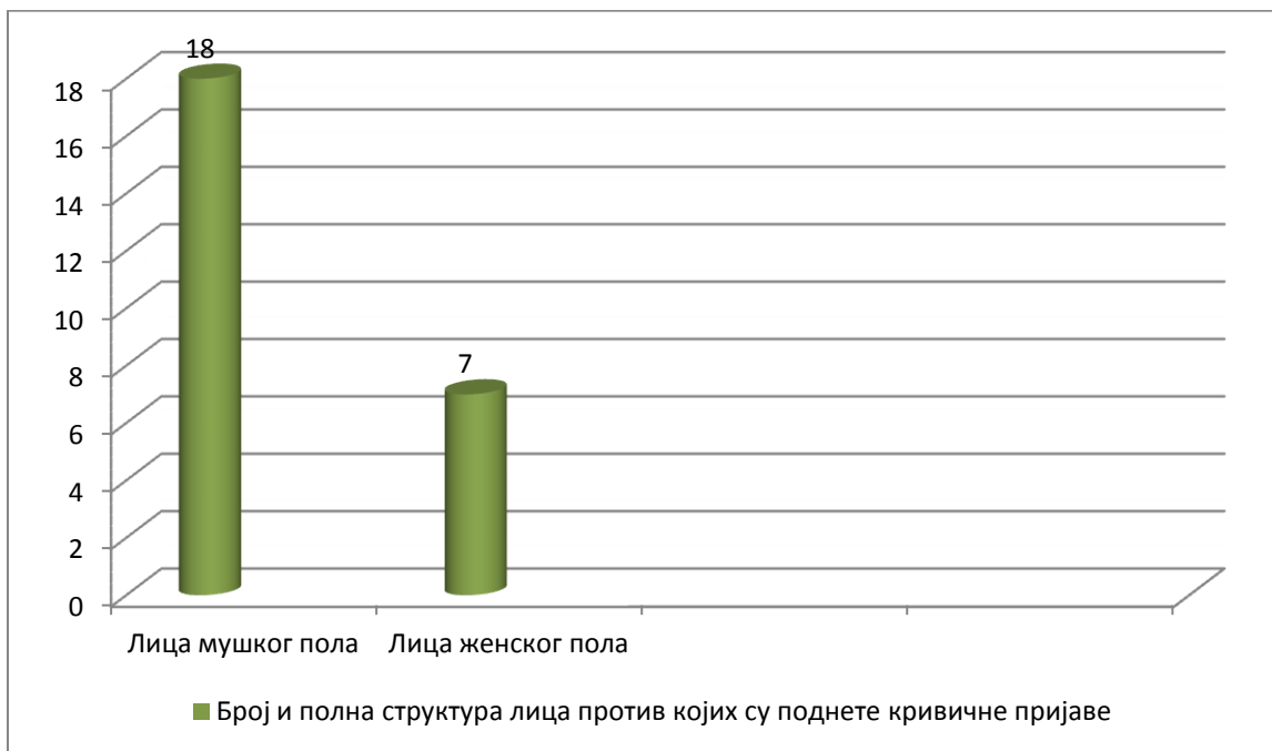
Графикон 2 – Број и полна структура лица против којих су поднете кривичне пријаве

У Табели 2 приказано је бројно стање и полна структура лица против који су поднете кривичне пријаве где је за посматрани период укупно поднето 25 пријава. Примећује се да је од укупног броја, више лица мушког пола у односу на женски пол, 18 су лица мушког пола или 72%, док су свега 7 лица женског пола, односно 28%.