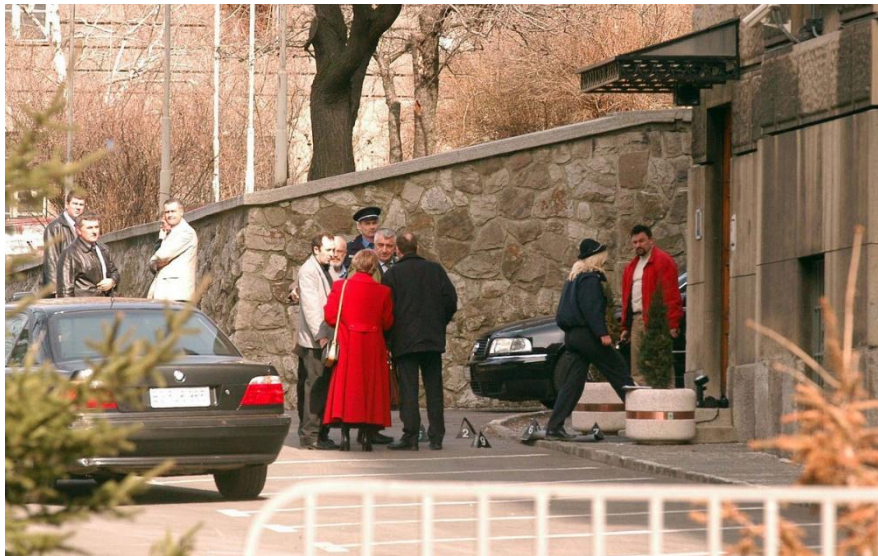
Слика 2. Увиђај на месту убиства некадашњег премијера Зорана Ђинђића

одредбама. Тимове чине: истражне судије, јавно тужилаштво или заменици, оперативни радници који раде на смањењу крвних злочина, криминалистички техничари, лекари специјалисте судске медицине, и др. надлежни органи, зависно од средства које је коришћено приликом извршавања кривичног дела.