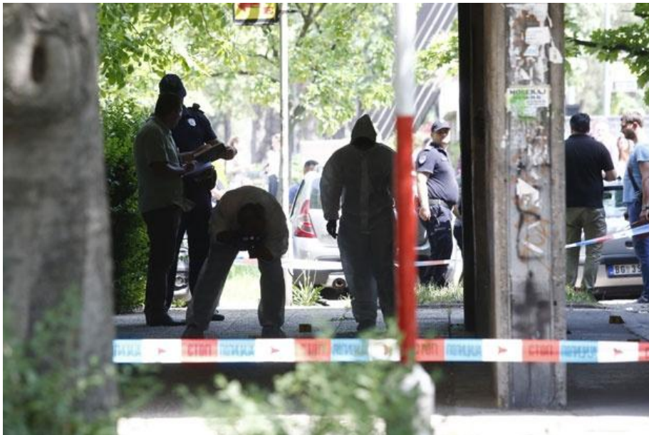
Слика 1. Тим форензичара тражи потенцијалне трагове на месту убиства

Затечени траг крви на месту злочина, служио је као траг елиминисања, све до почетка примене генетике у криминалистику, то јест до откривања начина како да се користи ДНК (дезоксирибонуклеинска киселина) тест који нам омогућава лакшу идентификацију, као и отисак папиларних линија, отуда и назив „генетски отисак прста“.