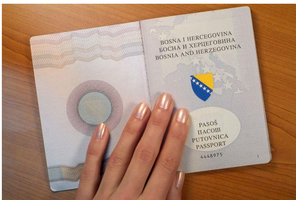
Слика 6. Пасош Босне и Херцеговине

( https://sr.wikipedia.org/wiki/Пасош_Босне_и_Херцеговине ).