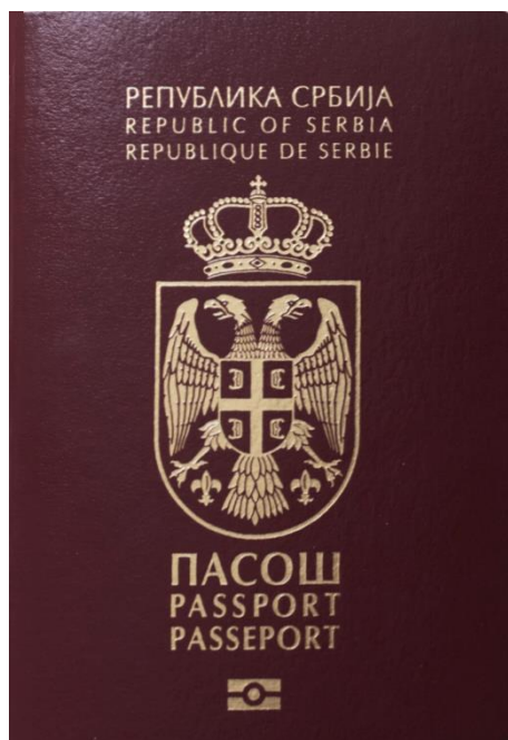
Слика 1. Пасош Републике Србије ( https://sh.wikipedia.org/wiki/Pasoš_Srbije ).

Исправа која се издаје држављанину Републике Србије ради путовања у иностранство без путне исправе, а свакако и ради повратка у Републику Србију јесте путни лист.