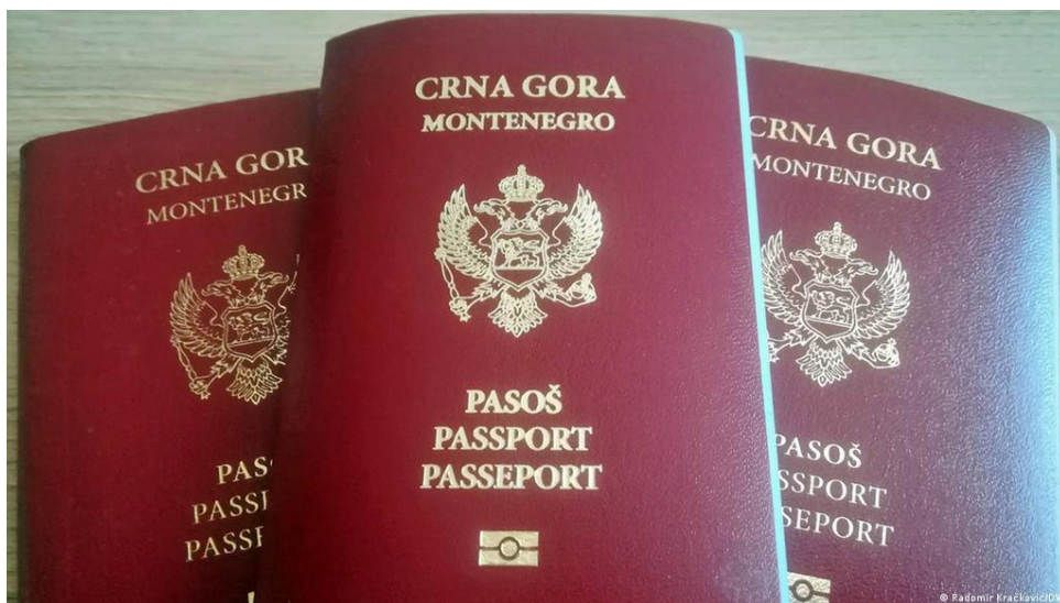
Слика 3. Пасош Црне Горе ( https://sr.wikipedia.org/wiki/Пасош_Црне_Горе ).

Међутим, орган којем је поднет захтев за издавање путне исправе, исти ће одбити ако је: