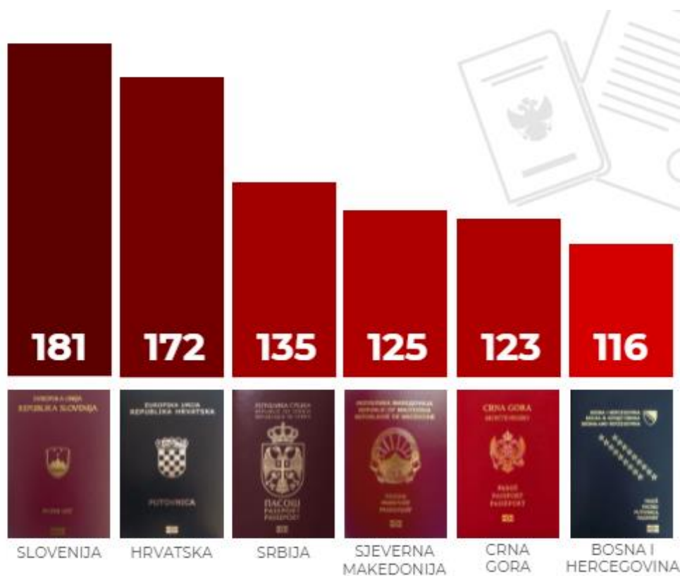
Слика 4. Број држава у којима грађани са држављанством Словеније, Хрватске, Србије, Северне Македоније, Црне Горе и Босне и Херцеговине могу путовати без визе ( https://www.bankar.me/2021/10/25/pasosi-u-regionu-drzavljani-crne-gore-mogu-bezvizno-putovati-u-123-drzave-infografika/ ).