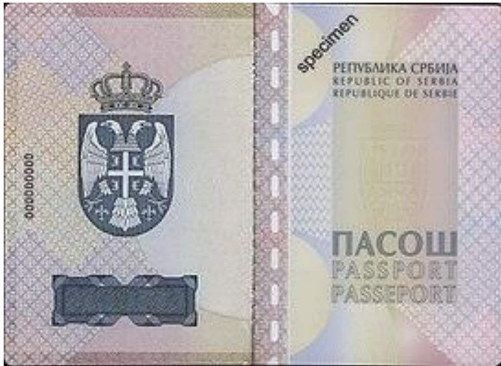
Слика 2. Пасош Републике Србије ( https://sr.wikipedia.org/wiki/Пасош_Србије ).

дана. Лице које поседује важећи пасош издат са роком важења од годину дана, захтев да му се изда нови пасош може поднети најраније 30 дана пре истека рока важења пасоша који је издат на период од годину дана. Након истека тог периода од годину дана, нови пасош се издаје са роком важења од 10 година. 19