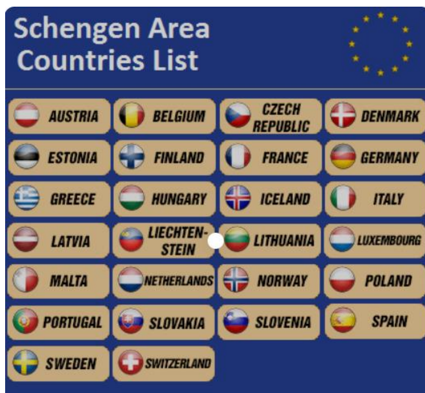
Слика 9. Државе Шенген зоне ( https://www.schengenvisa-info.com/schengen-visa-countries-list/ ).

Подручје Шенгена има површину од 4.312.099 квадратних километара и популацију од скоро 420 милиона људи. Сваке године има укупно 1,3 милијарде преласка шенгенских граница. Државе чланице шенгенског простора су појачале граничне контроле са земљама које то нису. 58