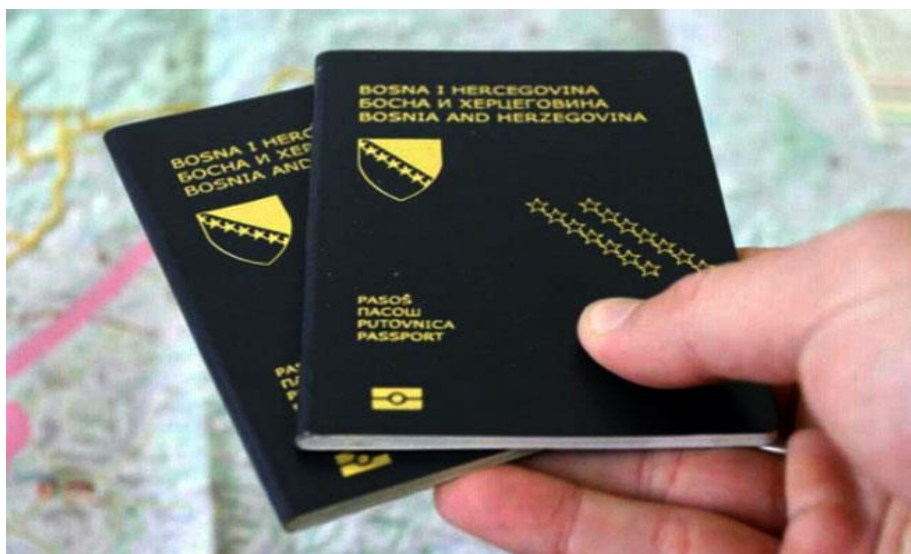
Слика 5. Пасош Босне и Херцеговине ( https://www.bihambasada.se/zahtjev-za-izdavanje-pasosa/ ).

Такође, захтев за издавање путних исправа се може одбити ако се основано сумња да ће подносилац захтева деловати противно прописима о забрани или ограничавању увоза или извоза, транспорта или распачавања опојних средстава или противно прописима из области царине, односно спољне трговине.