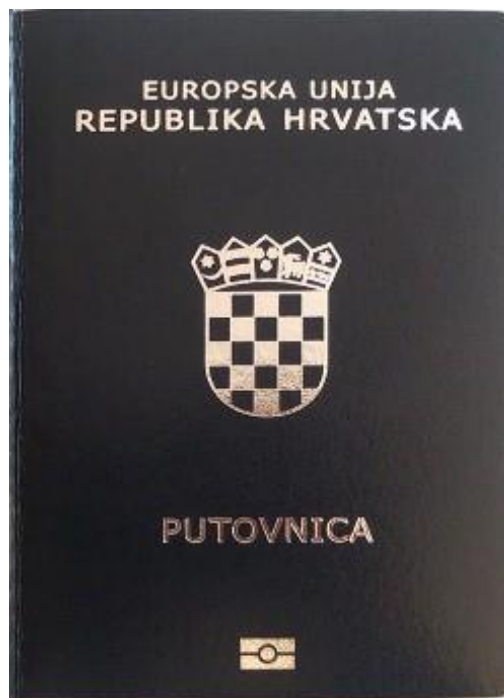
Слика 7. Пасош Републик Хрватске ( https://sr.wikipedia.org/sr-el/Пасош_Хрватске ).