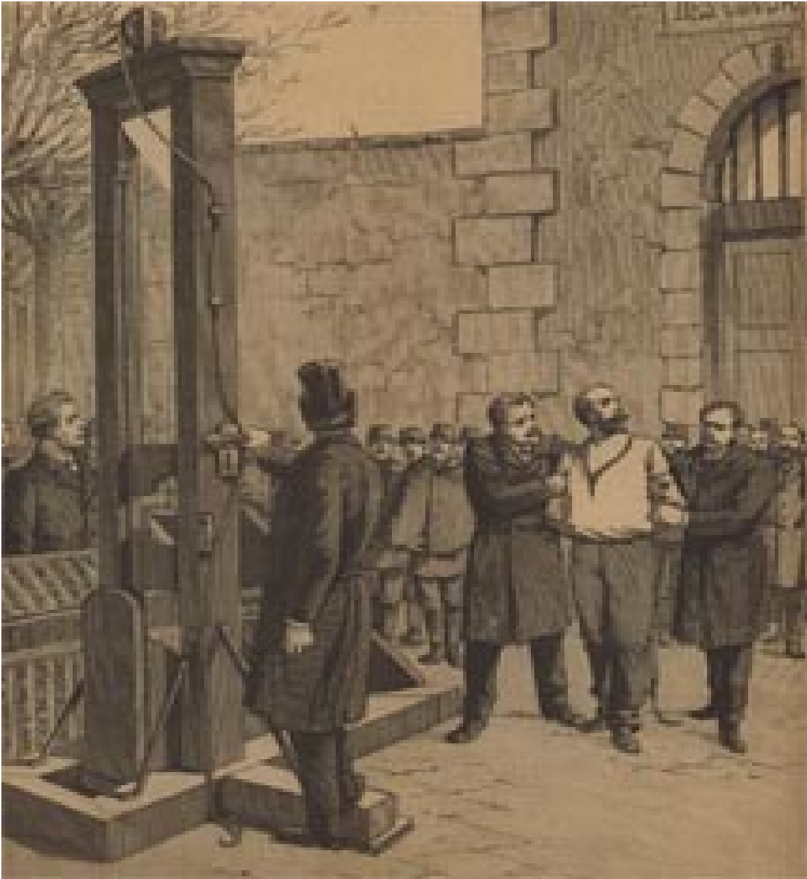
Izvršenje smrtne kazne giljotiranjem u Francuskoj