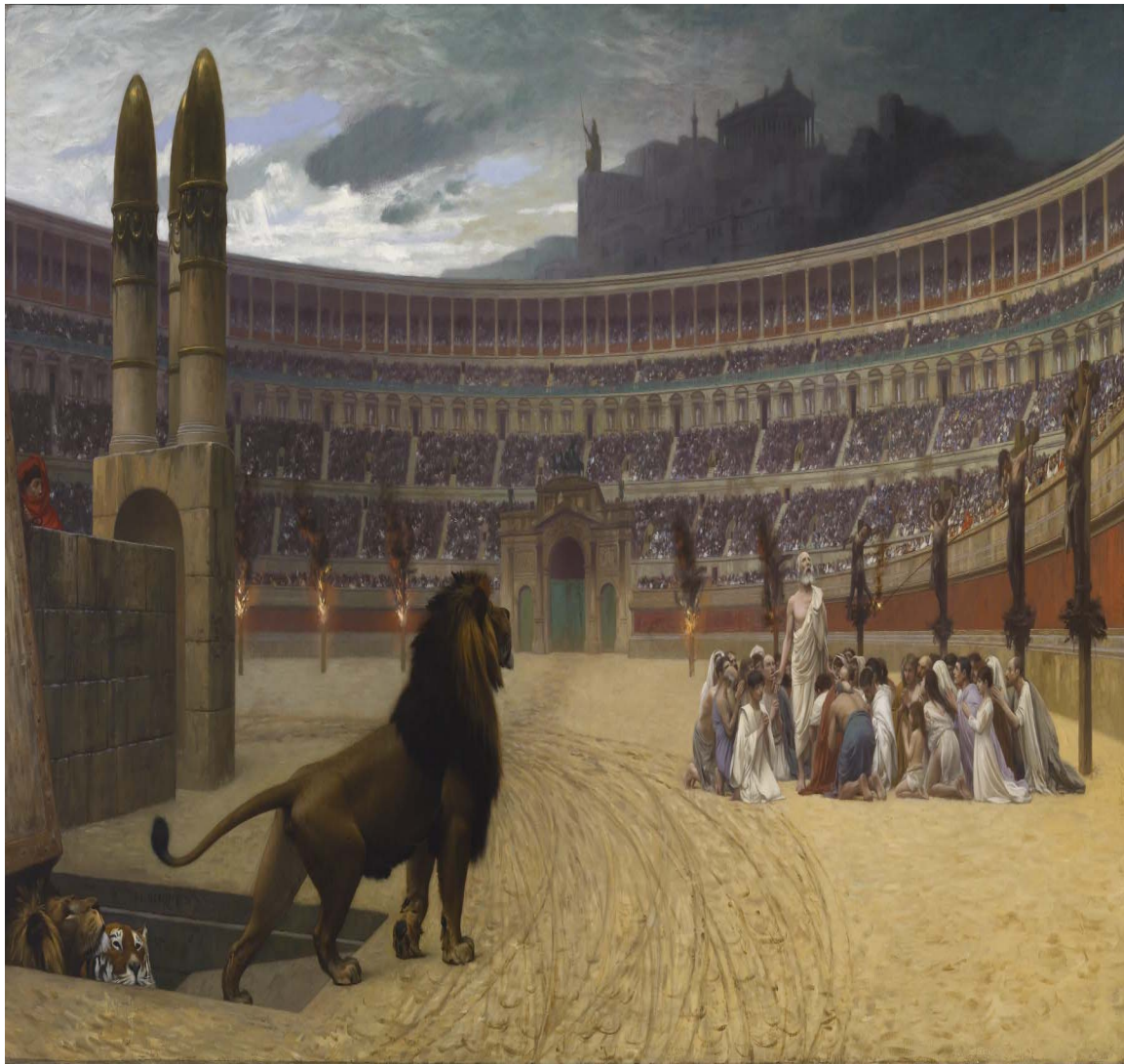
Izvršenje smrtne kazne u Rimu