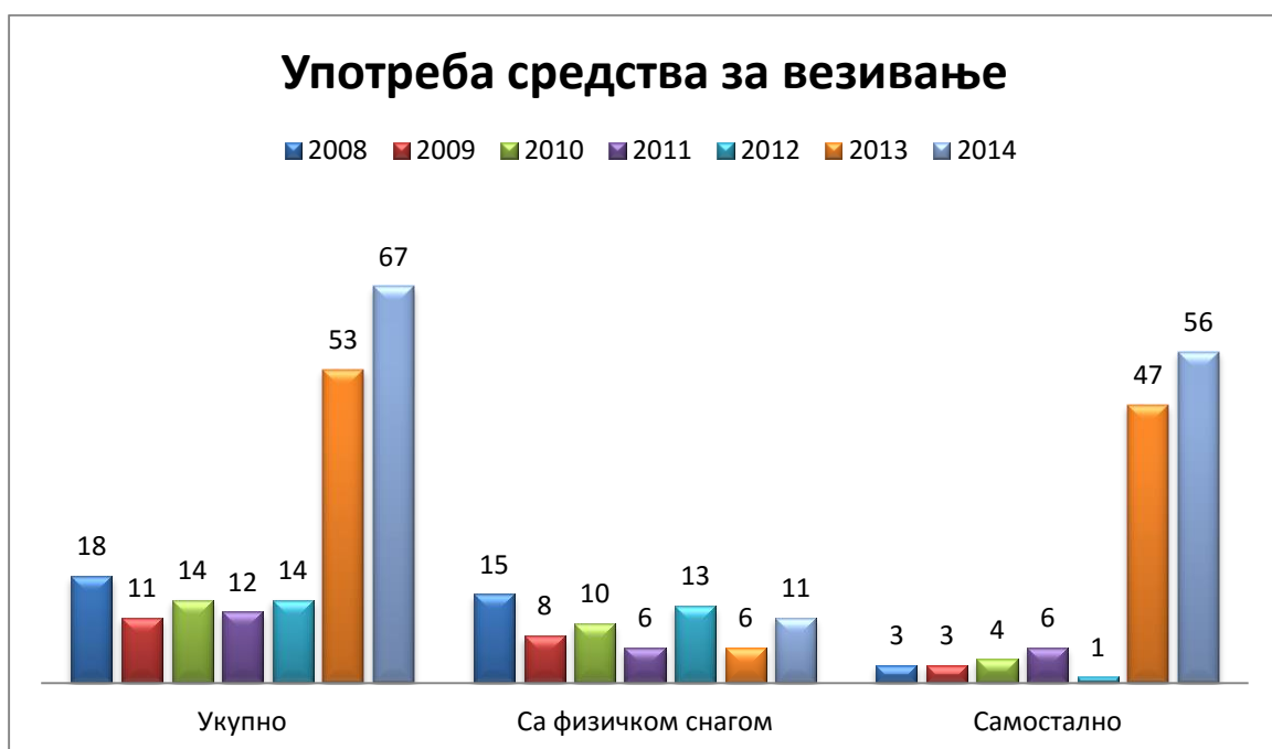
Табела број 4.

Анализом употребе средстава за везивање у ПИ Крушевац у временском периоду од 2008. године до 2014. године видећемо број употребе овог средства принуде и покушаћемо да разоткријемо велика одступања у броју употребе средства за везивање у појединим временским периодима.