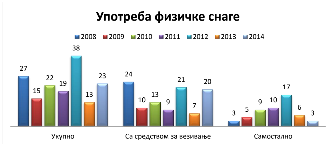
Табела број 2.

(Подаци из службене евиденције Полицијске испоставе Крушевац за наведене године)