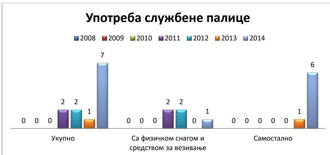
Табела број 3.

(Подаци из службене евиденције Полицијске испоставе Крушевац за наведене године)